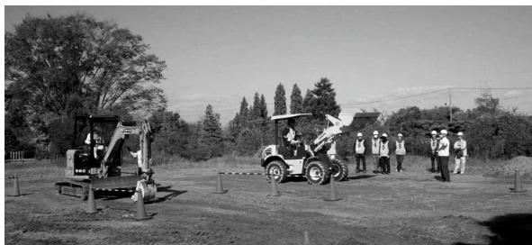
資格取得等講座 小型車両系建設機械特別教育