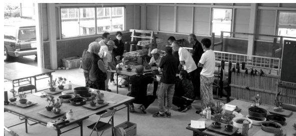
一般講座 盆栽技術ゼミ