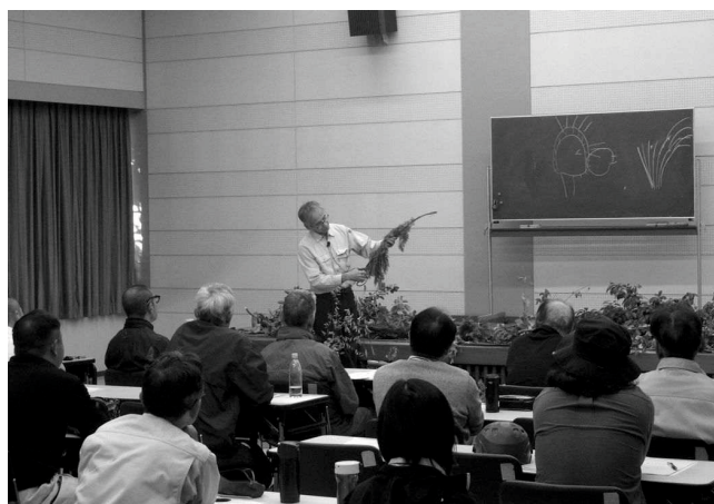
基礎講座 樹木の剪定・整枝