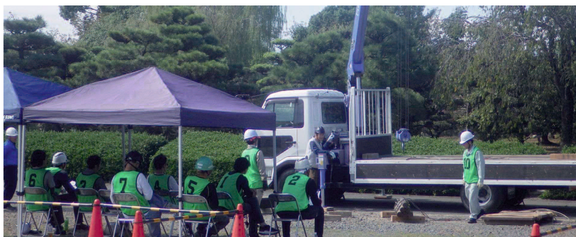
資格取得講座（小型移動式クレーン・玉掛け）