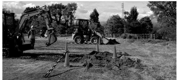
小型車両系建設機械運転安全衛生特別教育