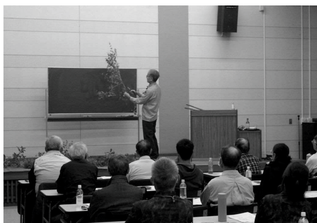
基礎講座 樹木の整姿・剪定