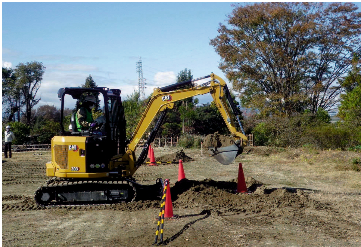
資格取得講座（小型建設機械運転）